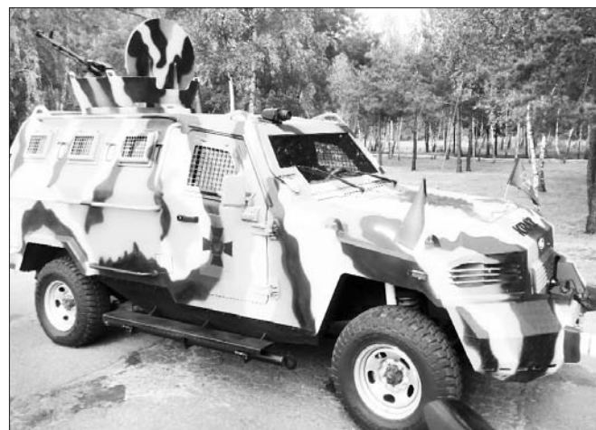
Цей КрАЗ оснащений тепловізором і крупнокаліберним кулеметом.